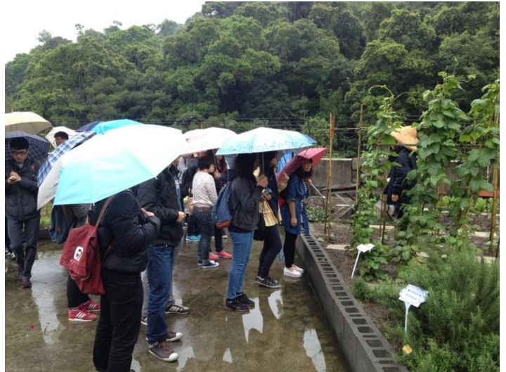
護理長帶領大家參觀病患認養栽植的屋頂花園